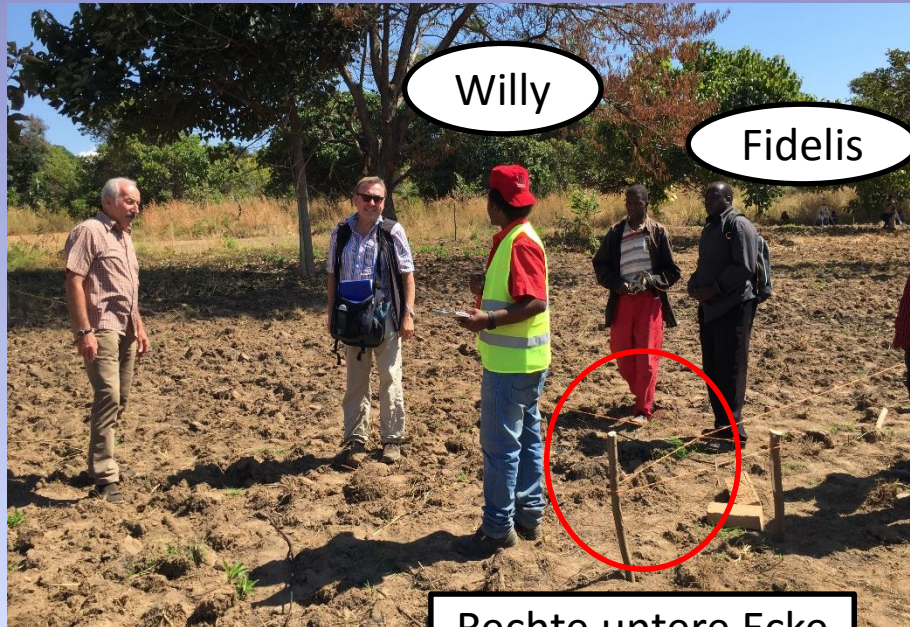
Rechte untere Ecke