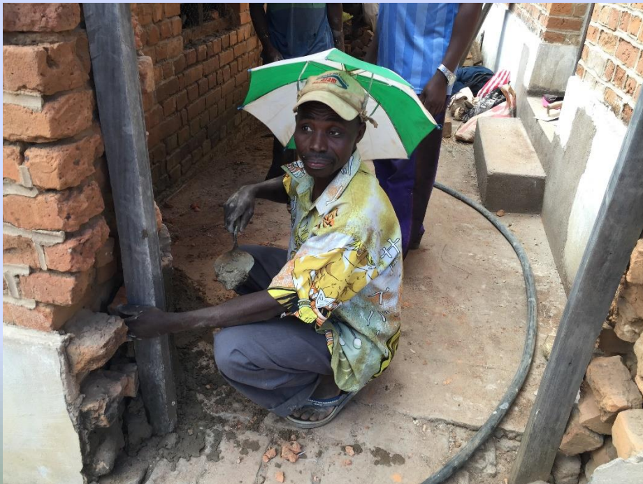
Der Bruder von Fr. Silverius hilft auch