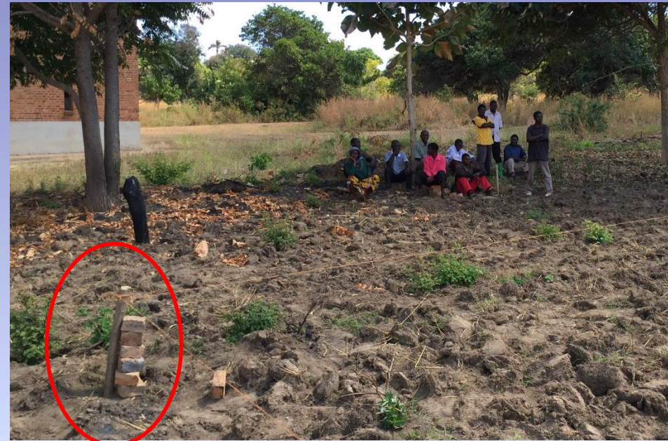
linke untere Ecke